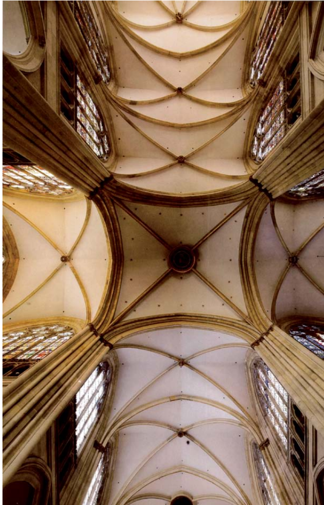
Dom St. Peter

Alles was wir erfahren ist eine Mitteilung So ist die Welt in der Tat eine Mitteilung – Offenbarung des Geistes