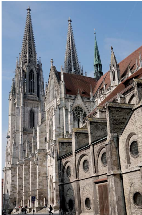
Dom St. Peter

1953 geboren. Im Hauptberuf Farbgestalter und Lasurmaler. Ausbildung als Werbefotograf. Seit 1979 als Gestalter selbständig. Pädagogische Zusatzausbildung. Ein Jahrzehnt Religionspädagogik. Freier Kursleiter und Gastdozent in der Erzieherausbildung.